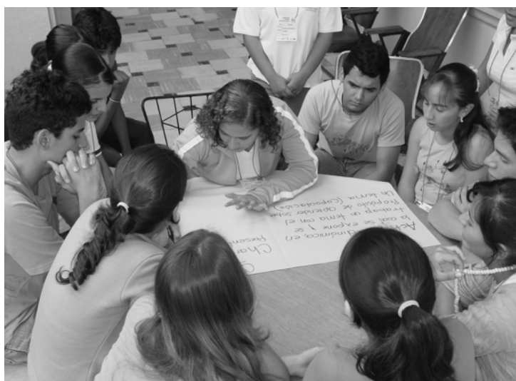
Para fortalecer y desarrollar habilidades personales para el trabajo en equipo, se realiza una sesión coordinada por MAC, en la hacienda El Guabal.