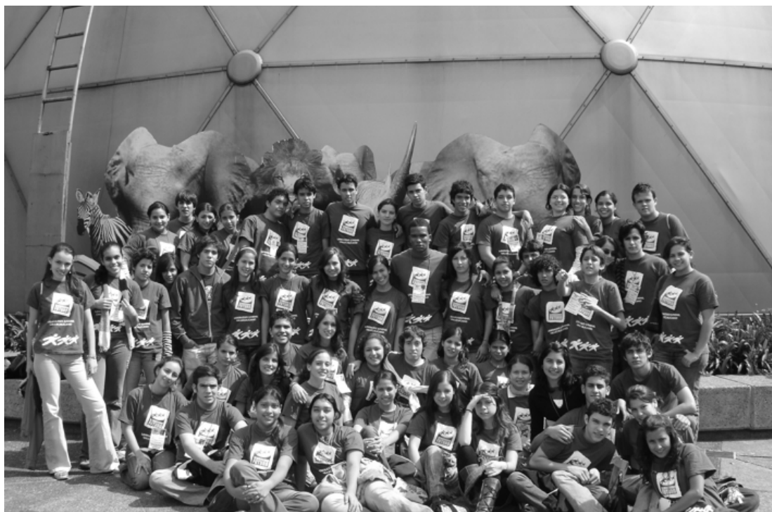
Ellos son los integrantes de la sexta promoción del programa. El año pasado, estuvieron en el Centro Interactivo Maloka, en Bogotá. En la capital conocieron, además, a destacadas personalidades del ámbito gubernamental.

años Sembrando Futuro se ha consolidado como un espacio de reflexión, partiendo de la identificación de algunos aspectos de la realidad social y la necesidad de promover el liderazgo compartido en el Valle del Cauca.