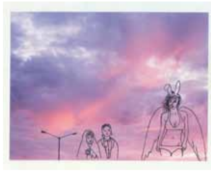
BRIGID NOONE 4.50pm / intervened photograph, 2011.