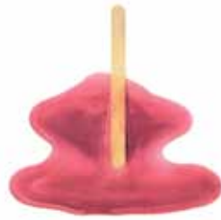
WILL NOLAN Raspberry Red C-type print (exhibition print, actual size 110 x 110cm), 2011.