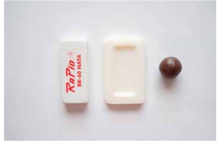
AKIRA AKIRA 8.54 pm / mixed-media, 2011.