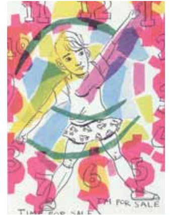
ROBIN TATLOW-LORD 3.12 am / drawing on paper, 2011.