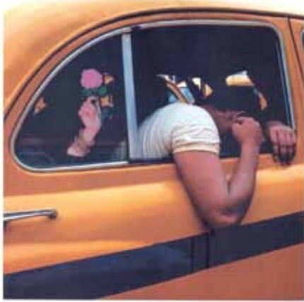
EMILIANO FERNÁNDEZ DE RODRIGO Untitled from the series 'Indian Fractions' / C-type print, 2011.