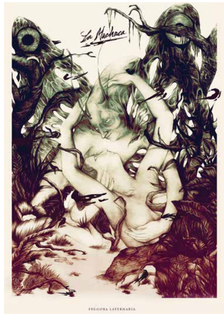
~ JUAN CAMILO CASTILLO (Colombia)

Ilustración portada: PicaFlor · http://www.flickr.com/photos/pica-flor/