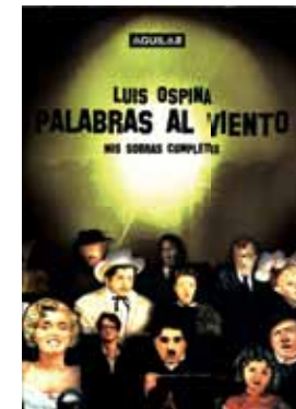
LUIS OSPINA PALABRAS AL VIENTO

Aquí están consignados todos los boletines que escribió para el Cine Club de Cali (cuando programaba la actividad cinéfila de la ciudad), todos los artículos que escribió para los distintos diarios ( Occidente, El Espectador, El País, El Pueblo ), entrevistas, fragmentos de sus diarios, algo de ficción y una joya: El crítico en busca de la paz, se da toda la confianza . Un texto a medio camino entre el ensayo, la diatriba y la narrativa caicediana en el que presenciamos una crítica de cine a su vida: “Tal vez si hubiera bailado la canción completa a todas estas sería bailarín y no poeta”.