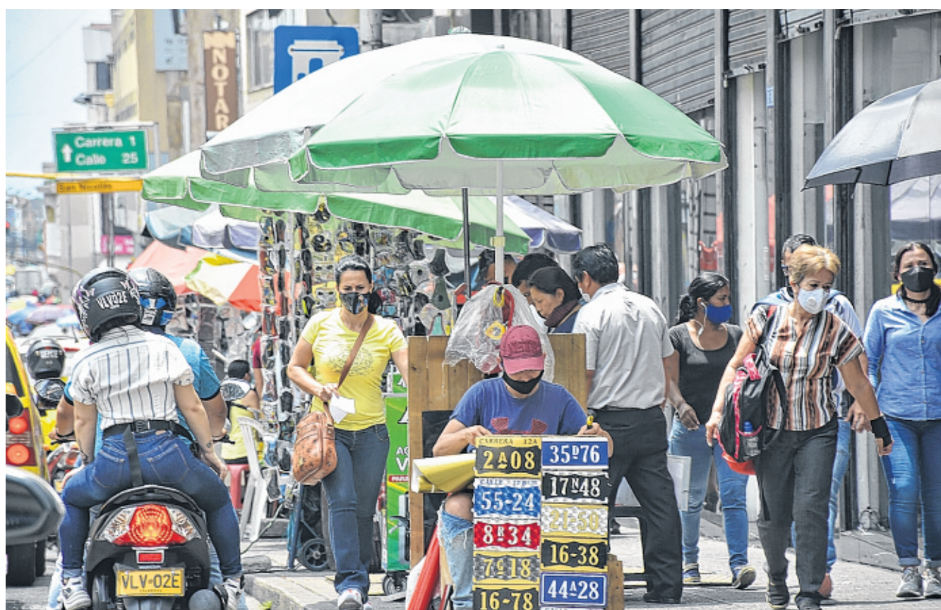
El incremento de la informalidad a raíz de la cuarentena es otra problemática que necesita ser intervenida en esta nueva etapa en Cali. La Alcaldía ha llamado a aplicar el autocuidado para generar confianza en el consumidor.

■ En Santa Marta fueron aprobadas las condiciones para la apertura de las playas, luego de que se establecieron los protocolos de bioseguridad. Por lo tanto, la reapertura fue programada para el próximo viernes 18 de septiembre, según dieron a conocer las autoridades.