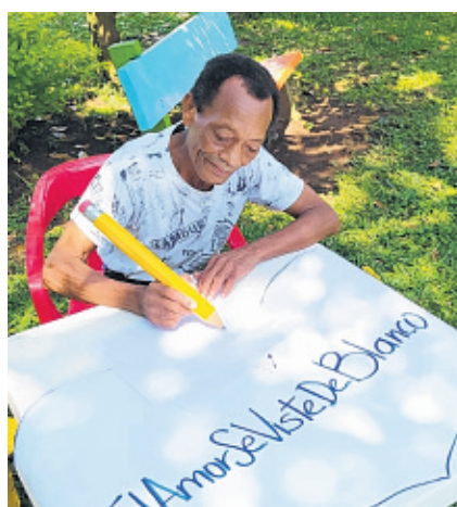
Miembros de la Fundación Cottolengo escribieron las primeras cartas.

Es por eso que a partir de hoy las autoridades del Valle invitarán a usuarios en redes sociales a escribir las palabras con las que se desean exaltar el trabajo de los médicos, enfermeras, acompañadas del hashtag #ElAmorSeVisteDeBlanco.