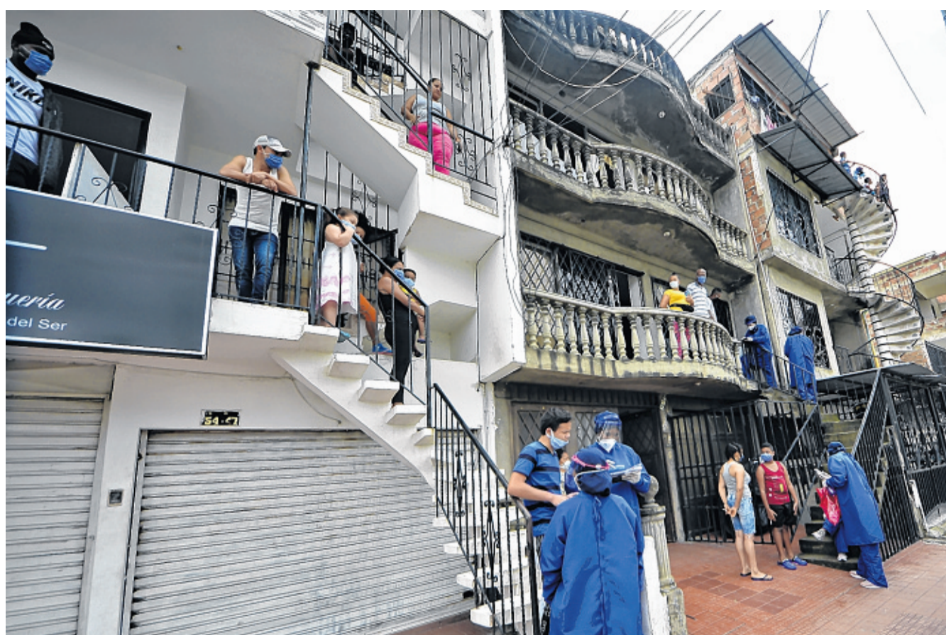
De acuerdo con el Observatorio Polis de la Universidad Icesi, la confianza entre vecinos de estratos bajos es mucho menor que la de los altos. Al parecer, esto sería atribuible a los niveles de crimen que reina en algunos barrios de Cali.