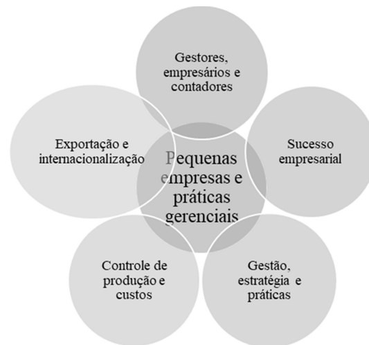
Figura 2. Eixos temáticos encontrados

Na sexta etapa, foram coletados todos os artigos da nossa amostra que totalizaram 140 e foram excluídos 60 de acordo com os métodos estabelecidos, resultando em um total de 80 artigos utilizados. Na sétima etapa, foi elaborada uma planilha no Excel, onde foram elaborados os resumos de cada artigo selecionado no final da sexta etapa (como por exemplo: metodologia, amostra, objetivo). Por fim, tem-se a oitava etapa, que se configurou na identificação das semelhanças temáticas entre os artigos, sendo formados 5 eixos: gestores, empresários e contadores; controle de produção e custos; sucesso empresarial; gestão, estratégia e práticas; e, exportação e internacionalização. Os eixos encontrados podem ser visualizados na figura 2 .